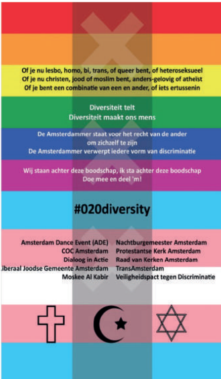
↑ Bij locaties van welzijnsorganisatie SOOZ in Amsterdam Zuid hangt deze poster bij de ingang om te laten zien dat LHBTI personen zich ook welkom en veilig kunnen voelen.