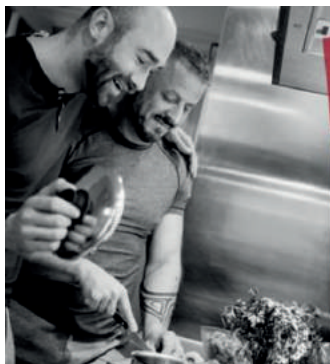
↑ Regenboogkookworkshop door SWOA Arnhem